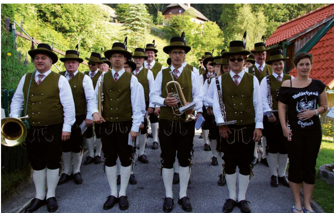
Die Braut konnte der Blasmusik auch am Tag der Hochzeit nicht widerstehen und griff selbst zum Piccolo.