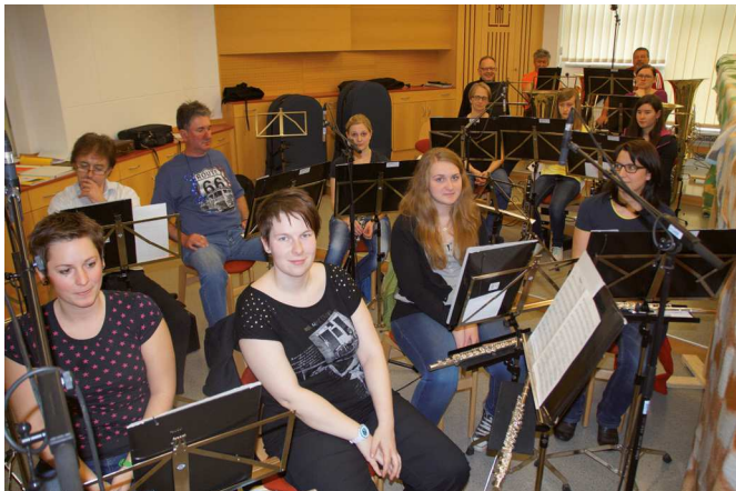
Die Musikerinnen und Musiker des Musikvereins spielen in dem zum Aufnahmestudio umfunktionierten Proberaum.