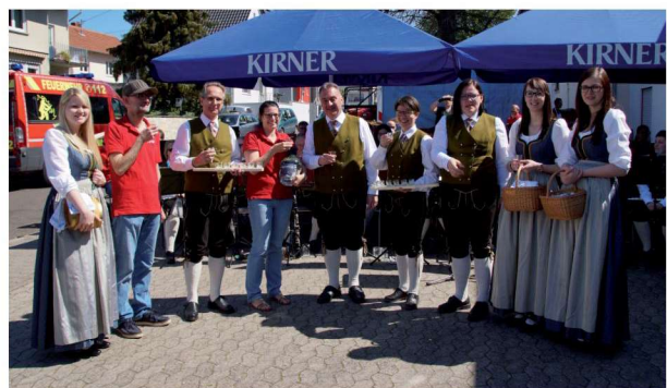
Beim Frühschoppen wird auf die musikalische Partnerschaft angestoßen.