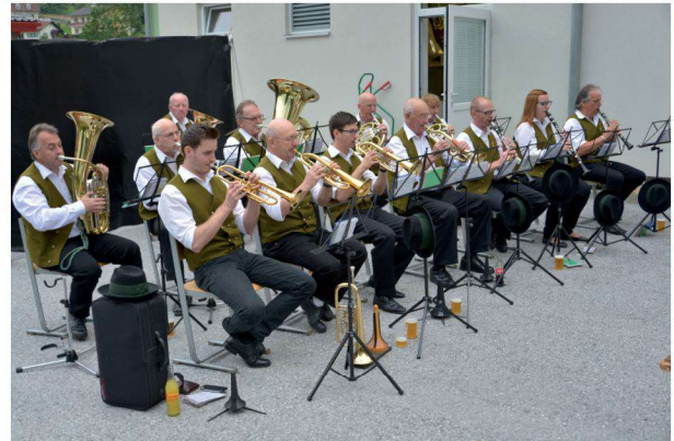
Die Bauernkapelle Ratten bei ihrem Auftritt im Rahmen des Musikerfests

Das Engagement in diesen kleinen Gruppen zeigt einmal mehr, mit welchem Spaß und welcher Freude die MusikerInnen des Musikvereins Blasmusik in unterschiedlichsten Varianten spielen und dadurch zum Gelingen von Veranstaltungen im privaten, aber auch im öffentlichen Bereich beitragen.