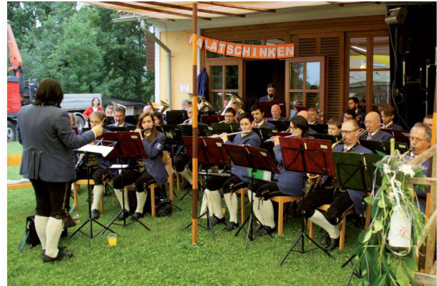
Ab in's Trockene beim Frühschoppen in Graz - St. Peter

Mittlerweile schon zur Tradition geworden ist auch der Frühschoppen beim Pfarrest in Ratten, welches nach der Prozession vom Gasthof Krainer und der anschließenden Erntedankfeier in der Pfarrkirche zum Heiligen Nikolaus stattfand. Den Abschluss der Sommer- und Herbstsaison 2016 bildete ein Konzert anlässlich des 20-Jahr-Jubiläums der Fleischerei Sommersguter in Ratten.