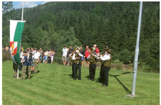
Ein Quartett des Musikvereins beim Bereichsjugendfeuerwehrlager