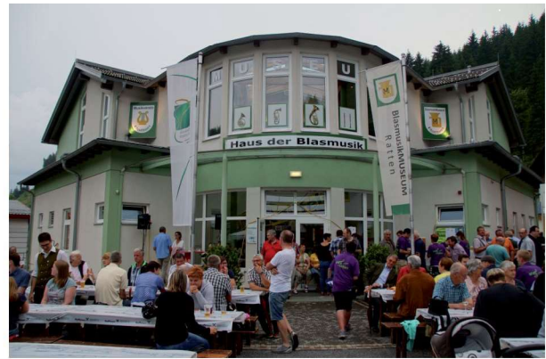
Gute Stimmung rund ums Musihaus

2017 wird es im Rahmen des Musikerfestes den ersten Rattener Musiwandertag geben. (Den Termin finden Sie in der Vorschau auf Seite 12.)