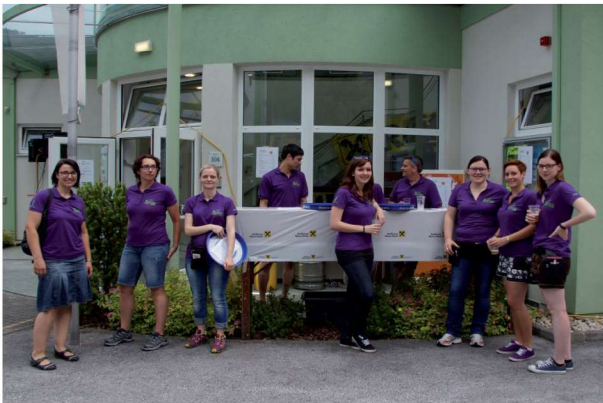
Die MusikerInnen in ihren neuen T-Shirts.

Auch bei der zweiten Auflage unseres Musikerfestes „Rund ums Musihaus“ am 25. Juni 2016 durften wir wieder zahlreiche Gäste begrüßen. Leider spielte das Wetter nicht ganz mit und die Bauernkapelle, die die Veranstaltung eröffnete, musste eine ungeplante Regenpause einlegen. Unsere Gäste wurden aber nicht nur ums, sondern auch im Musikerhaus bestens versorgt, und somit war die Stimmung großartig.