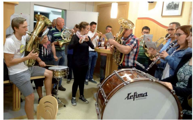
Die MusikerInnen des Musikvereins beim Musizieren im Rahmen einer Geburtstagsfeier