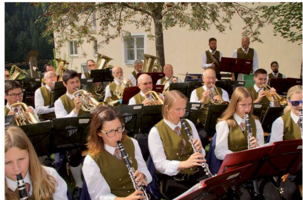
Der Musikverein Ratten beim Frühschoppen im Rahmen des Pfarrests in Ratten.