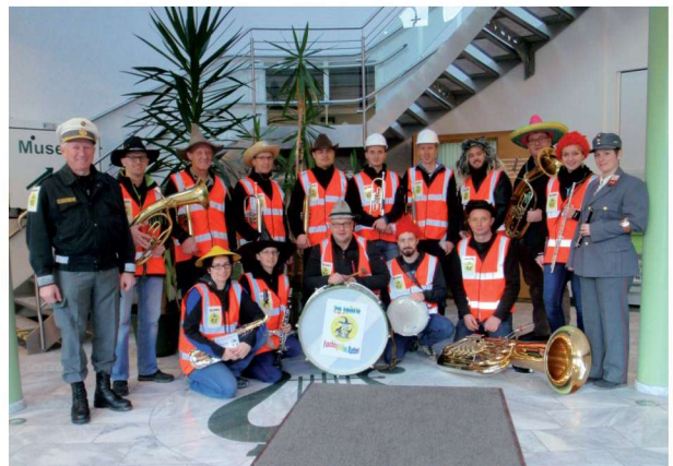
Die Faschingsblos 2016