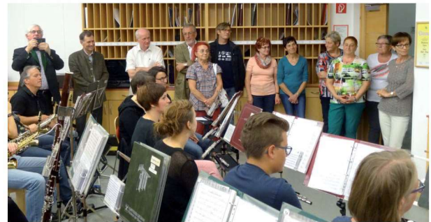
Auch die Partnerinnen und Ehrenmitglieder dürfen bei den Geburtstagsfeiern nicht fehlen.